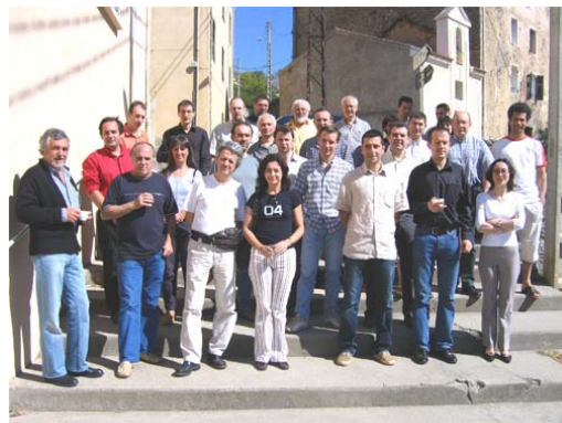
Les participants au workshop à Calacuccia.

En organisant ce workshop dans le Niolu, l'Université de Corse fait la preuve que la solidarité dans la répartition des activités culturelles sur un territoire en difficulté peut être une réalité si l'on s'arme d'un peu de volonté.